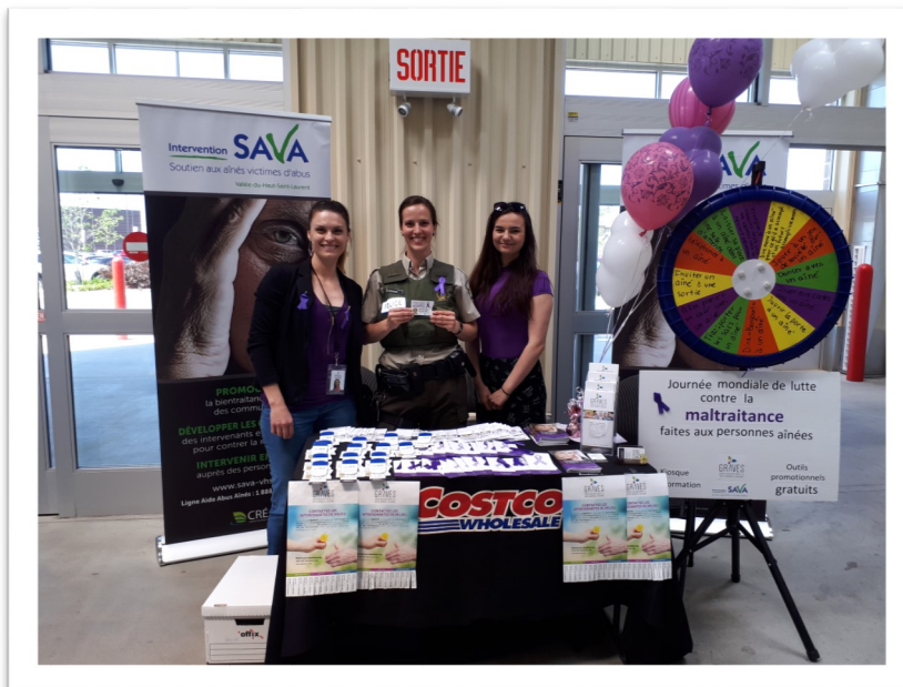
COSTCO DE VAUDREUIL