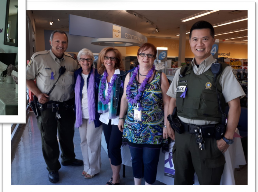
PHARMAPRIX DE PINCOURT