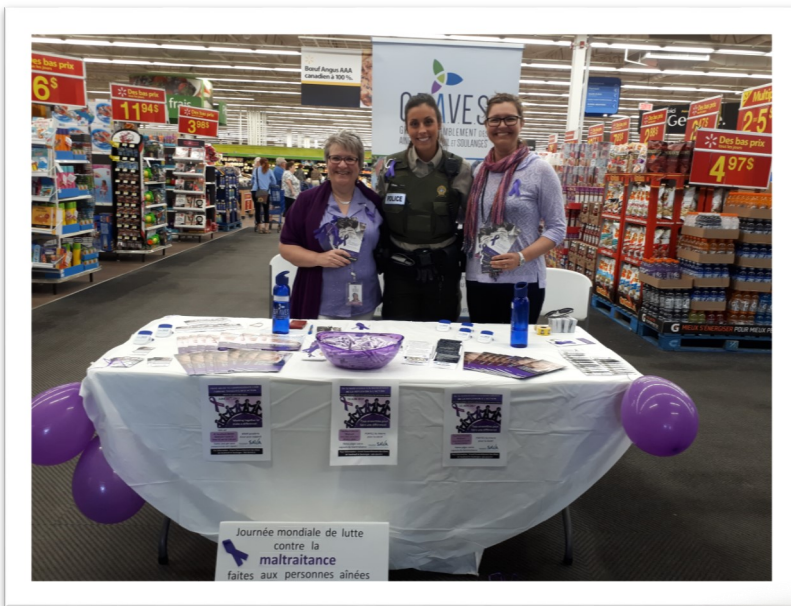
WALMART DE VAUDREUIL

Journée mondiale de la lutte contre la maltraitance des personnes âgées / 15 JUIN