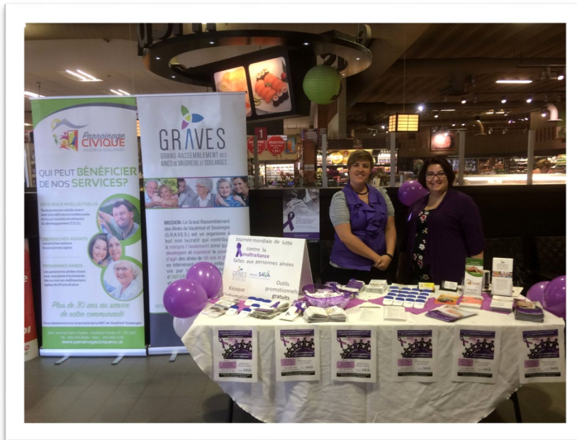
MÉTRO FORDHAM (ST-ZOTIQUE)